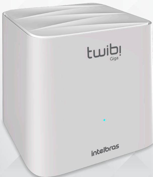
Roteador wireless Mesh