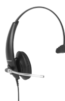
THS 50 Headset mono QD