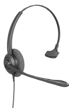
CHS 60 Headset mono QD