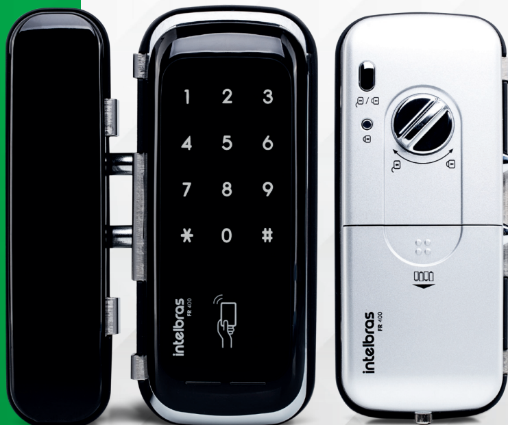
Fechadura digital de sobrepor para portas de vidro