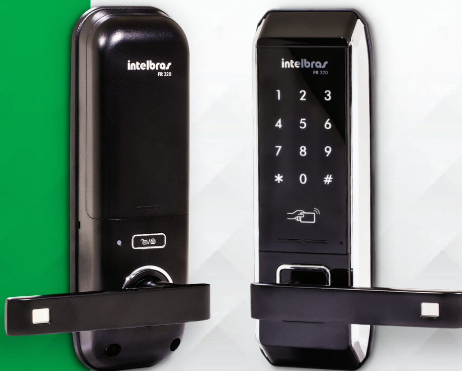
Fechadura digital de embutir