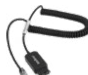
QDI 10 Cordão QD RJ9 inteligente