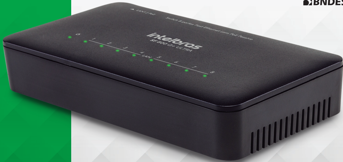
Switch Fast Ethernet