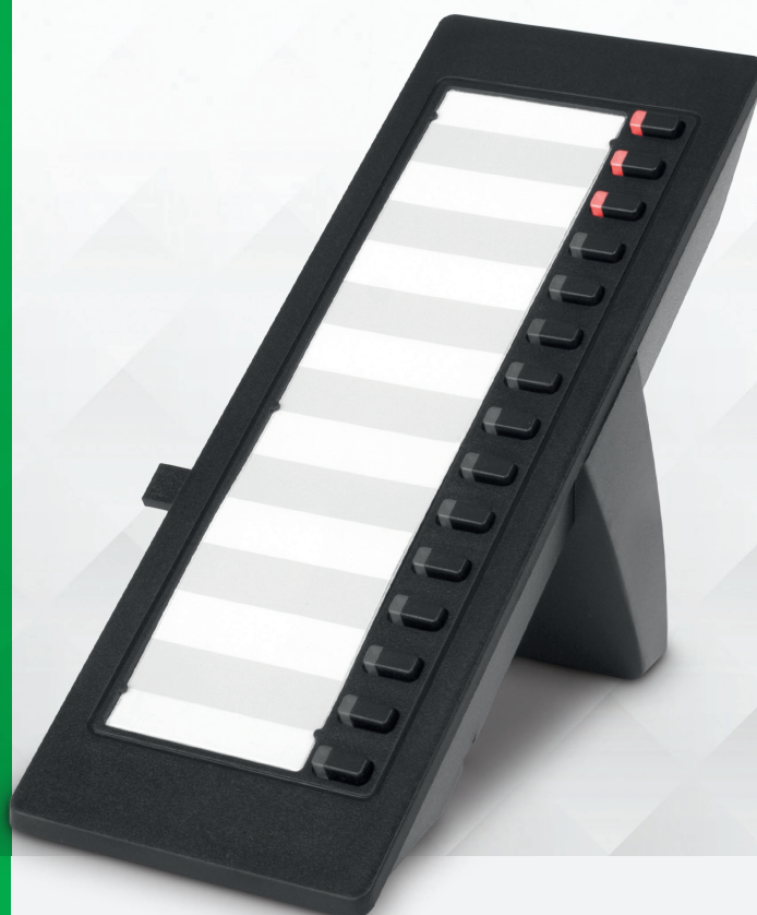
Módulo de teclas