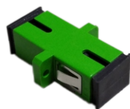
Adaptador óptico APC