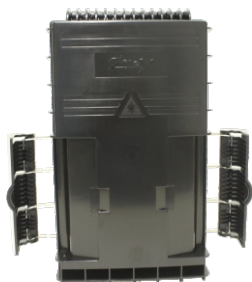
CTO 16FO DUAL