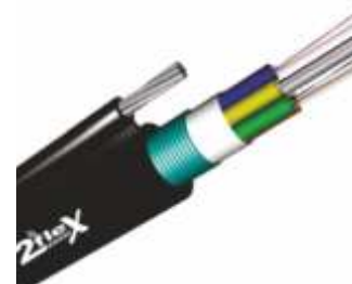
Cabo Óptico FIG 8