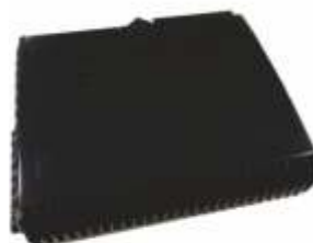
CTO - Terminação Óptica