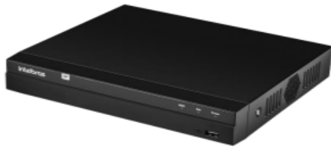
Gravador Digital de Vídeo NVD 1408