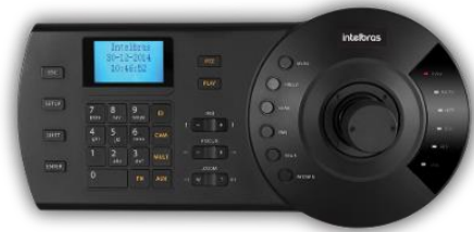
Mesa Controladora Híbrida (Analógica e IP) VTN 2000