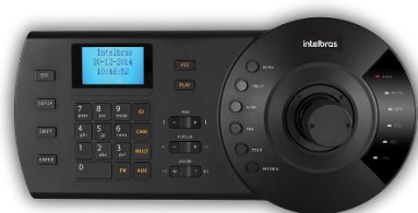
Mesa Controladora Híbrida (Analogica e IP) VTN 2000